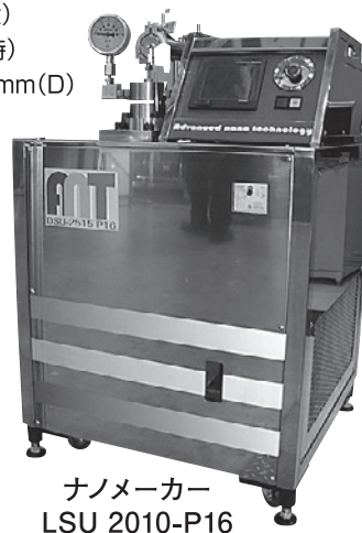
ナノメーカー LSU 2010-P16

電池素材(太陽電池、燃料電池、二次電池)、電子材料、ハイブリッド素材(無機+有機)、FPDコート材、インク、無機スラリーの流動化、医薬・化粧品基材、CMPスラリー