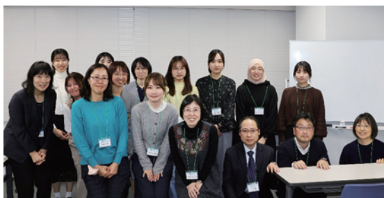
本部会議室での交流会