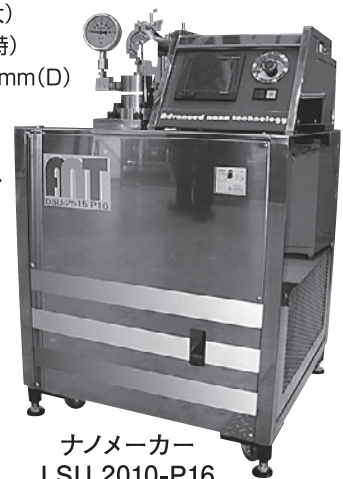
ナノメーカー LSU 2010-P16

電池素材(太陽電池、燃料電池、二次電池)、電子材料、ハイブリッド素材(無機+有機)、FPDコート材、インク、無機スラリーの流動化、医薬・化粧品基材、CMPスラリー